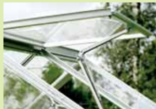
Extra takfönster och automatisk fönsteröppnare