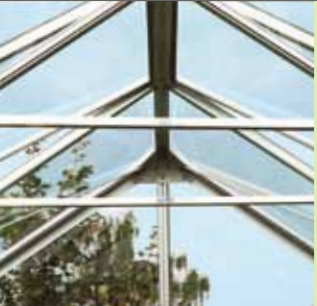
Takstöttor i Uranus

Ett stort växthus kan användas som en kombination av lusthus och växthus.