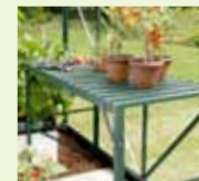
Växthusbord med extra hyllplan