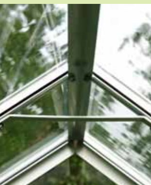
Takstöttor i Venus

Köp inte ett för litet växthus. Ingen har någonsin klagat över att deras växthus är för stort!