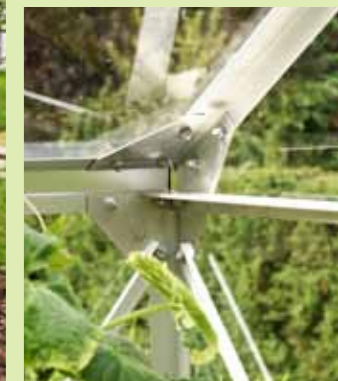
Hörnförband i Merkur

Alla Merkur-modellerna kan levereras med 6 mm kanalplast i taket och glas i resten av huset.