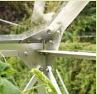
Hörnförband i Uranus

Ett stort växthus kan användas som en kombination av lusthus och växthus.