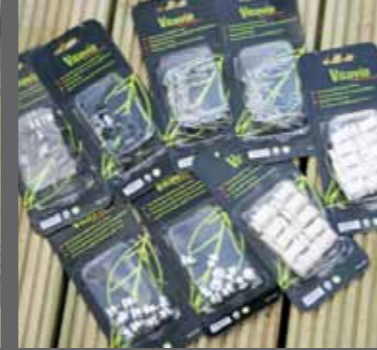
Clips, Bult, Mutter och uppbindningskrok m.m.