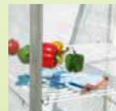
Hyllset till IDA