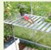
Överdel till växthusbord