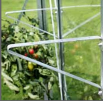
Hyllkonsoler · 2 st inkl. bult & mutter