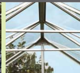
Takstöttor i Merkur

Alla Merkur-modellerna kan levereras med 6 mm kanalplast i taket och glas i resten av huset.