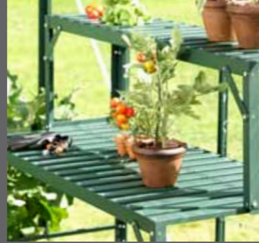
Överdel till aluminiumbord, grön