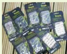
Diverse små tillbehör