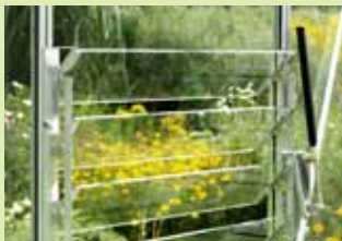
Jalusifönster och automatisk jalousiöppnare